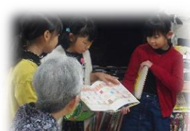
うらだての里等との交流活動