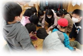
若草班(縦割り班)交流活動