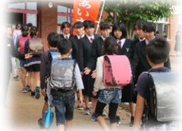
小中連携あいさつ運動