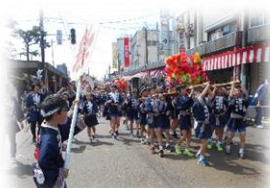
三条祭り大名行列〔子ども神輿(左) 傘鉾(中央) しゃぎり(左)〕